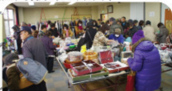
リサイクルバザー<会議室>