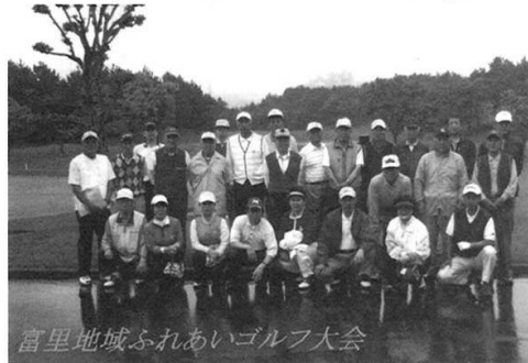
富里地域ふれあいゴルフ大会

あいにくの雨でしたが、近隣センターを出発したバスの中は、懇親会場となり、談笑が続きました。帰りのバスの中では表彰式が行われ、今日のプレーの話に花が咲きました。