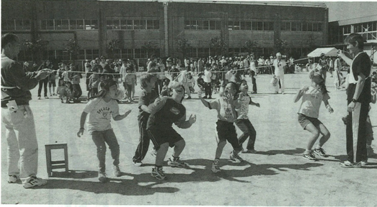
パンめがけて まっしぐら