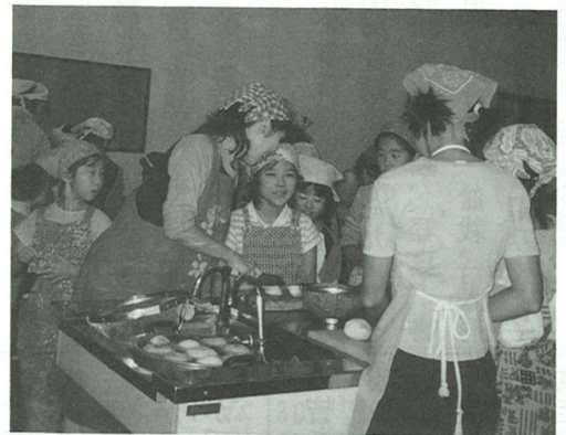
みんなそろって「いただきます」