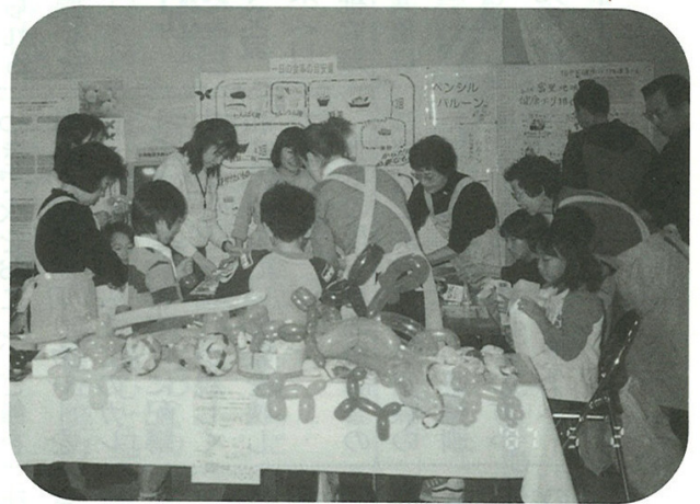
すてき作品ばかり