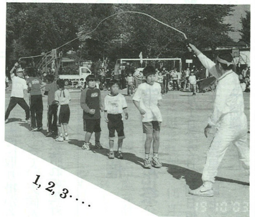
1, 2, 3...