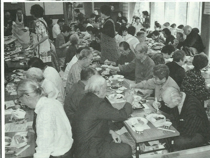
なごやかに話がはずみます