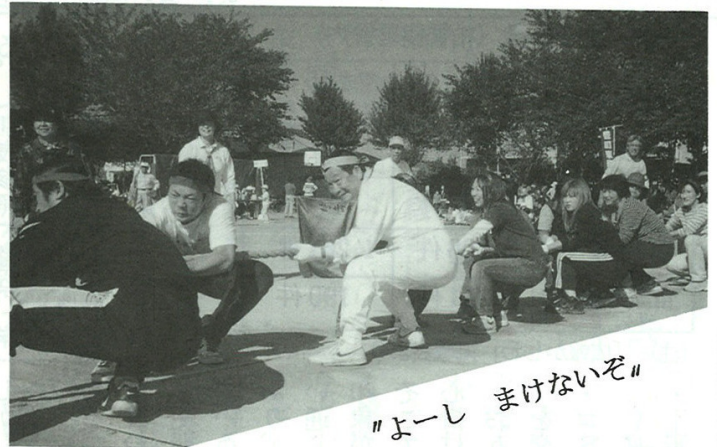
「よーし まけないぞ」