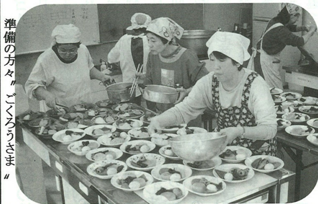
準備の方々「いんげんとうもろこし」