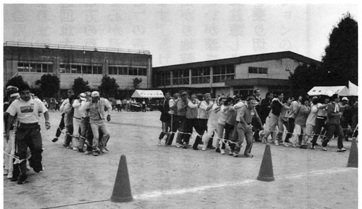
意気を合わせて1、2、3 熱戦です