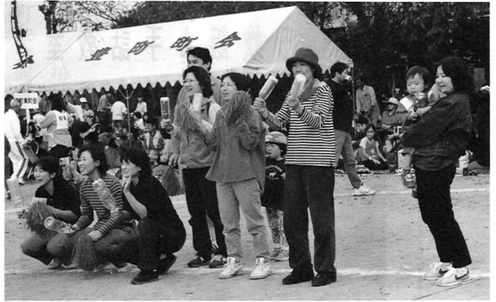
町会対抗ではペットボトルをたたいて大声援