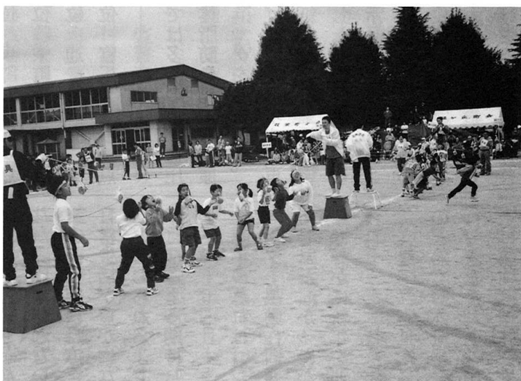
パンと格闘しています なかなかうまく取れません