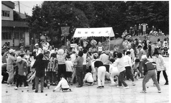
真っ赤な顔で 一生懸命かごをねらって投げています