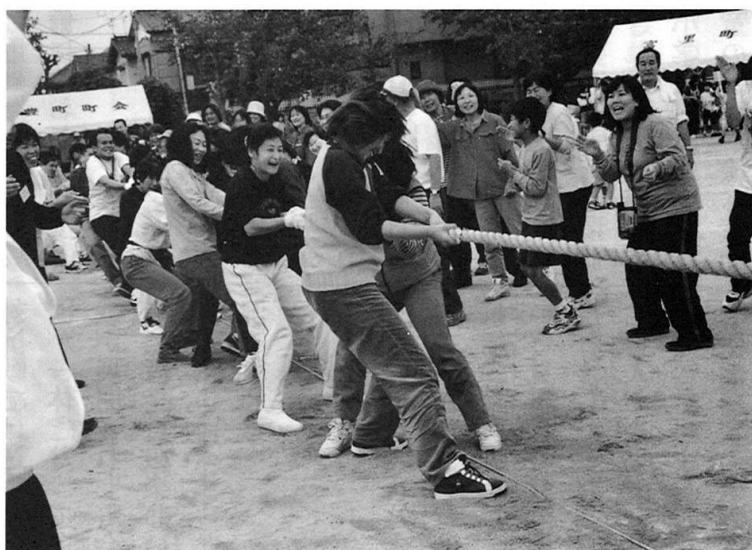
お母さんも頑張ってます 応援にも熱が入ります