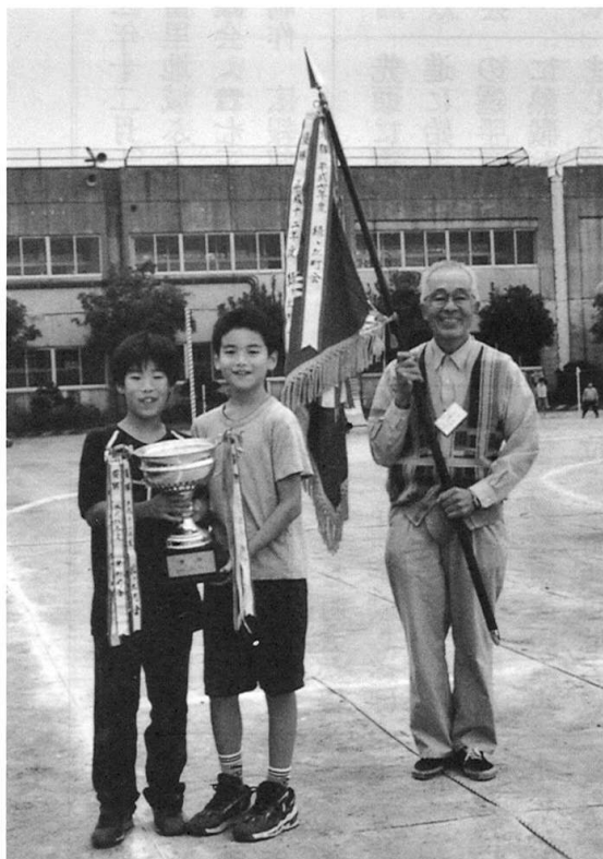
2連覇の緑ヶ丘町会 優勝旗とカップを手にご満悦