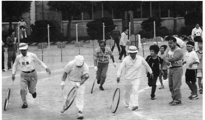
子供のときは得意だったのだがナー