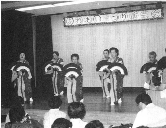
地元神明会有志による大黒舞 元気な老人会のみなさん