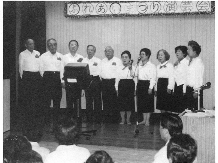
心に響くハアモニイを聞かせる双寿会メンバー