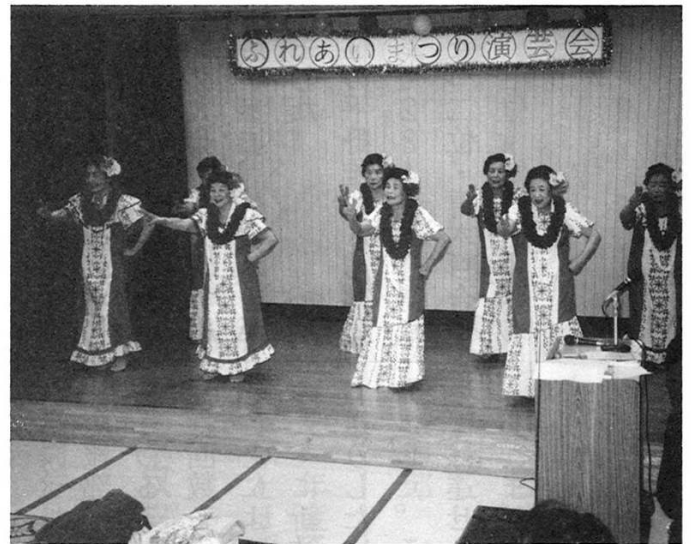
明和会の華やかなフラダンス 若さが満ち満ちています