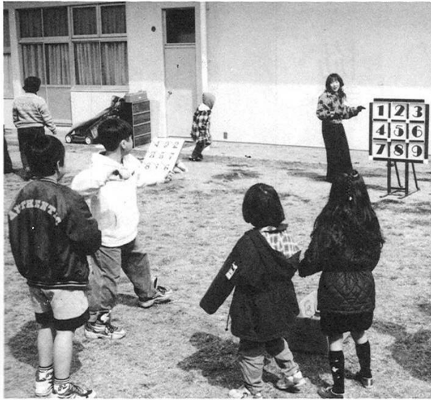
元気の的のボードにストライク コントロールが狂い、子供会のお母さんにストライク