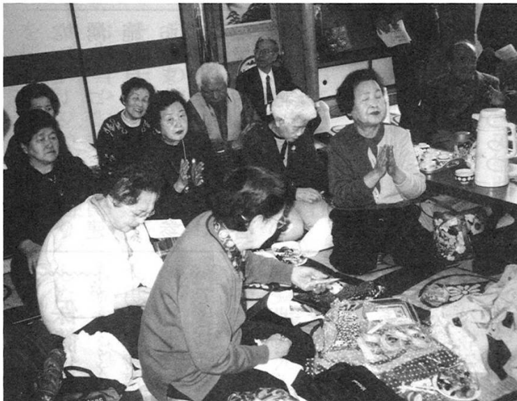
車座になり、お弁当を広げてステージを楽しむ