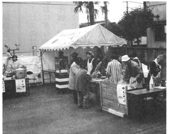
景気のいい掛け声でお客を呼び込む模擬店 お客さんと和気あいあい、話がはずみます