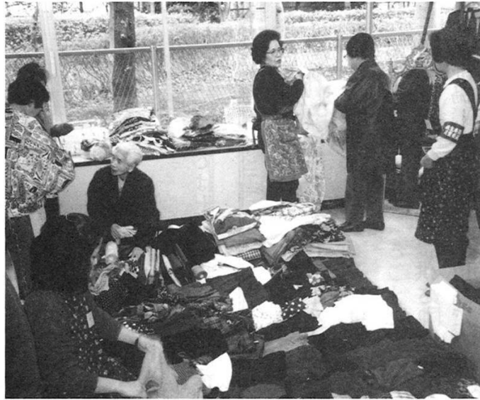
品定めで、にぎあうバザー会場 地域のみなさんから贈られたバザー用品