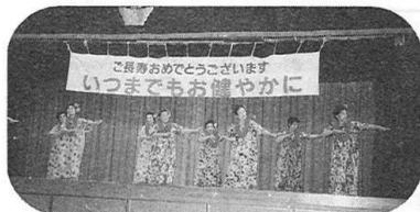
▲ 若さと明るさがいっぱい

富里地区福祉ネットワーク 事業推進委員会の主催で九月十五日、柏三小体育館で開催されました。参加人数は三百十八人でした。 三小児童および地域同好会の方々の演奏、歌、踊りなどに時の経つのも忘れた楽しい集いになりました。 いつまでもお元気で!!