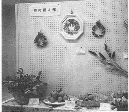
こんな上手にできたらなあ...