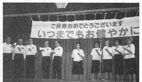
▲ 見事なコーラスは“知床旅情”