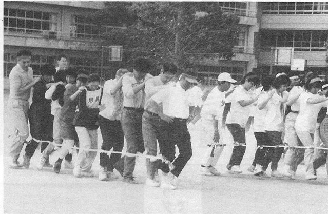
▲ 今年のメイン種目“むかで競争” (各町会の役員10名の選手で奮闘!)