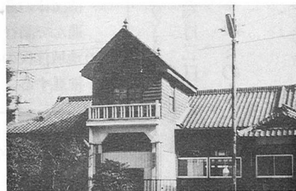
▲昭和21年頃 当時の会館

TOMISATO MIDORIGAOKA YUTAKA FUTABA SAKAE