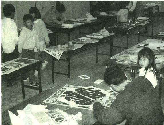
親子たこ作り教室 協議会 (12/12)