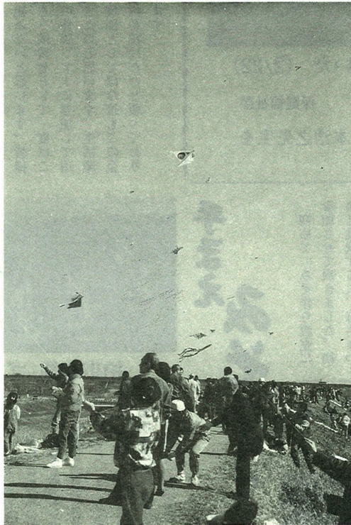
利根運河 水堰橋堤防 (1/23)