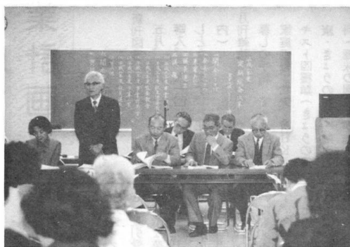
平成2年度 定期総会

コミュニティ推進の体制づくりが出来、活動実践も軌道にのって来た。八年半の実績の上に立つて進めるこれからの活動にと